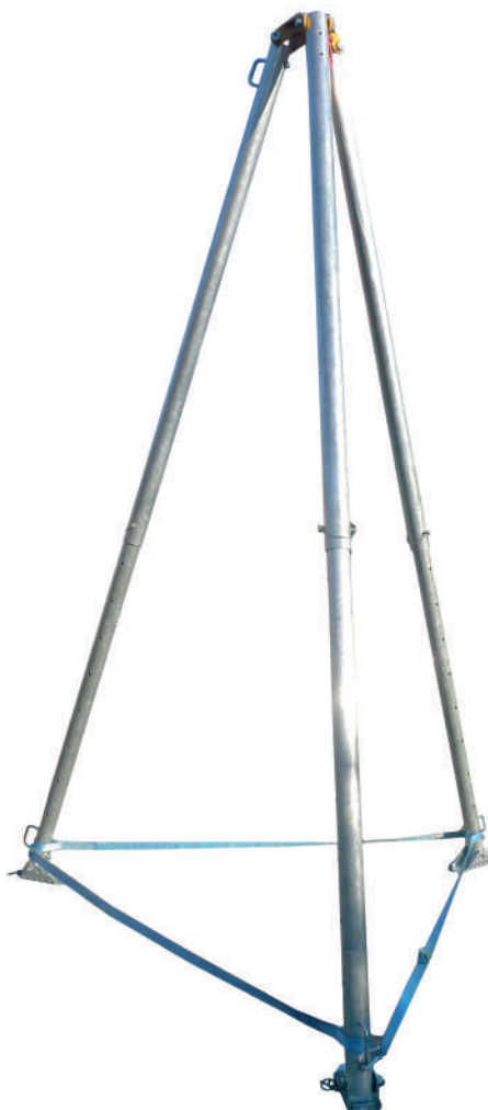
Tipo CT3 - 500 kg