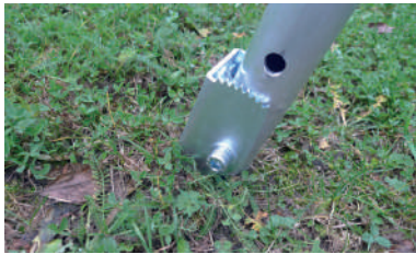
A punta per terreni soffici Spade-shaped end for soft ground