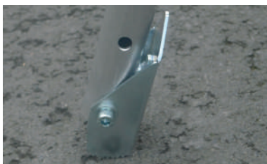
Zigrinata per superfici sdruciolevoli (solo il modello da 250 Kg) Notched side for slippery surfaces (only 250 Kg model)