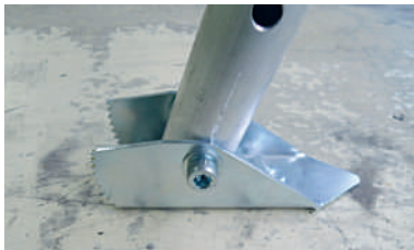
Con base piatta per superfici lisce Flat side for smooth surfaces