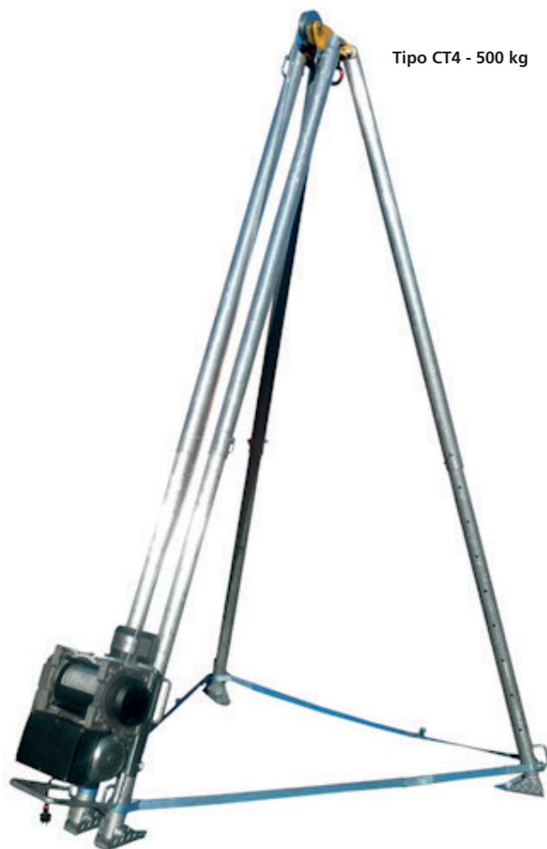
Tipo CT4 - 500 kg