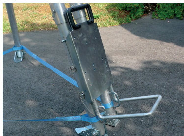
Base di fissaggio per l'argano. Fixation plate easy to set up.