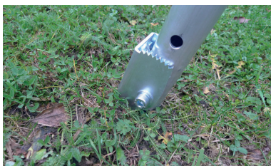
A punta per terreni soffici Spade-shaped end for soft ground