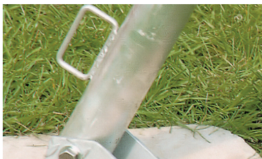
Con base piatta per superfici lisce Flat side for smooth surfaces